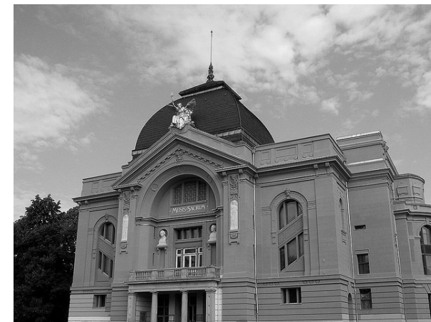
THEATER GERA

Auto: A4 Richtung Dresden, Ausfahrt 58a-Gera auf B7 in Richtung Gera-Zentrum/Greiz/ Zeitz/Bad Köstritz/B2 fahren, Links abbiegen auf Siemensstraße/B7, auf Berliner Str./L1302, Rechts abbiegen auf Clara-Zetkin-Straße/L130, Links abbiegen auf Puschkinplatz/L1302, links auf Breitscheidstraße, Reichsstraße, Schmelzhüttenstraße, Schülerstraße